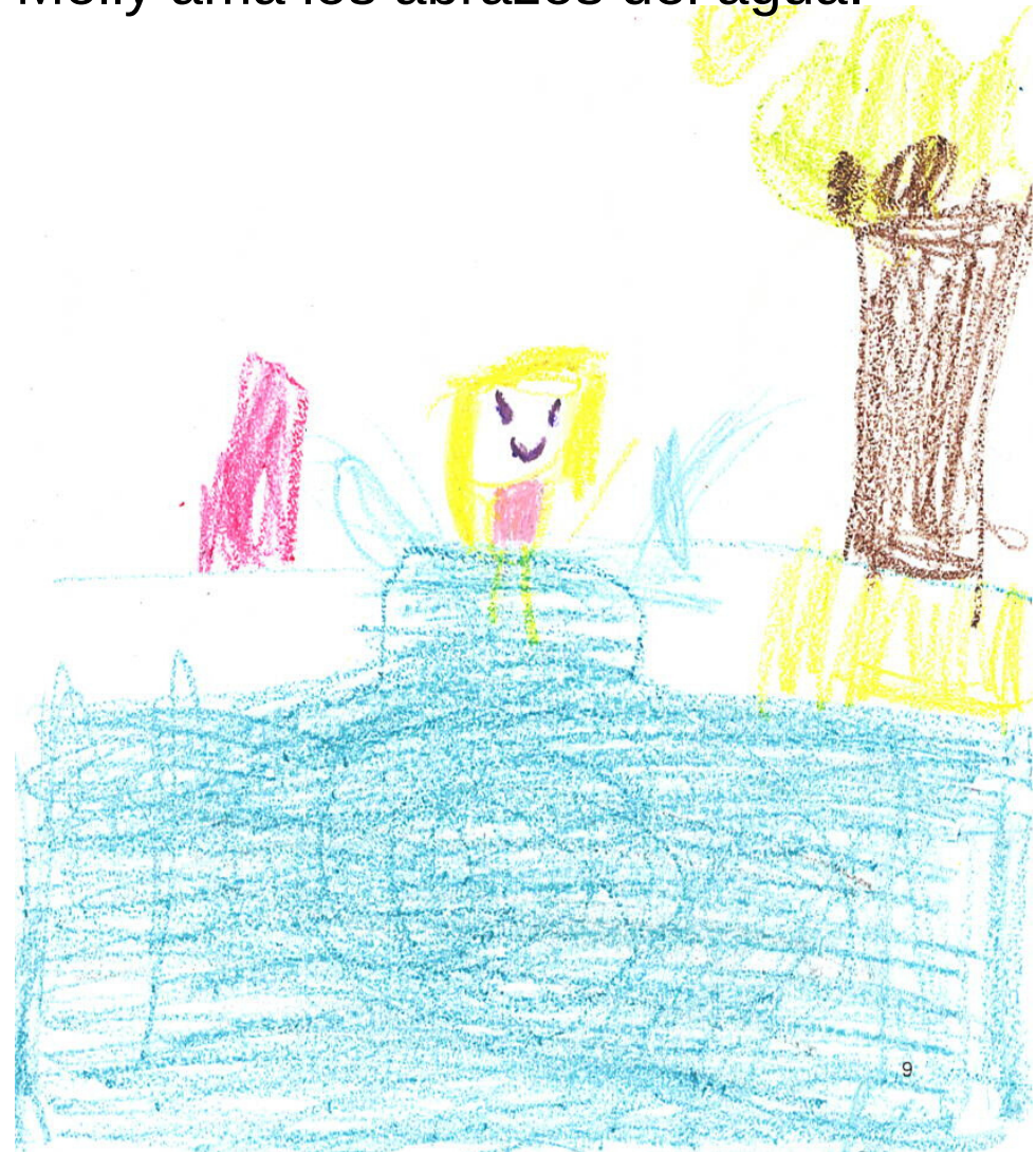
Summer, Age 7