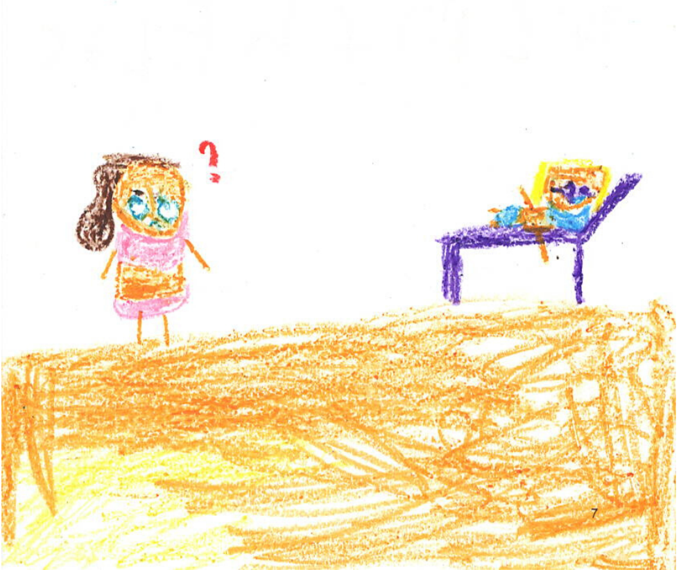
Isabella, Age 7

“¿A qué te refieres?” Molly le preguntó a su mamá.