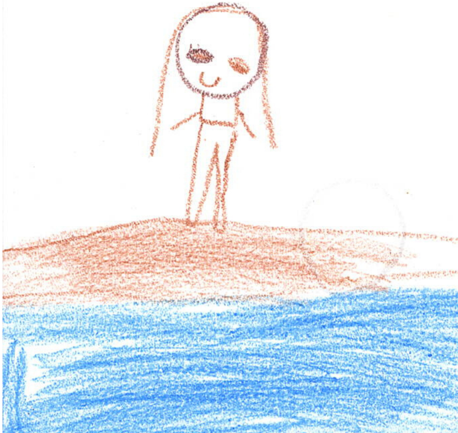
Janiyha, Age 7

utility.cityofpsl.com | (772) 873-6400 | utility@cityofpsl.com